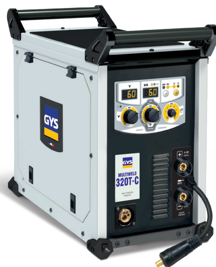
Entregue sem acessórios (063037)