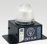
SLM : Smart Light Module 027978