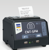
SPM : Smart Printer Module 026919