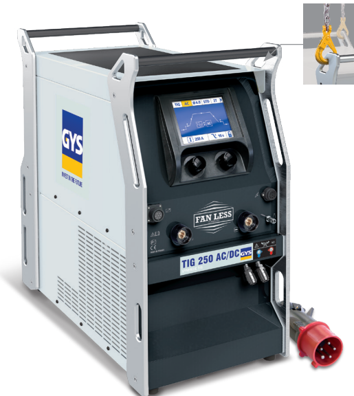
Artigo fornecido sem acessórios