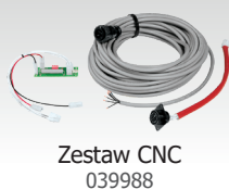
Zestaw CNC 039988