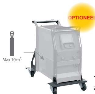
Trolley artikelnummer 040960

Easy modus of PRO modus voor een totale toegang tot de instellingen.