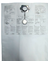
1 sacchetto per le polveri rif. 058880 (5 sacchi)