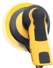
Levigatrice orbitale pneumatica con supporto disco di Ø152 mm. MIRKA PRO S 650CV