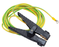
1 morsetto di terra