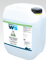
Liquido di raffreddamento 5 L rif. 062511