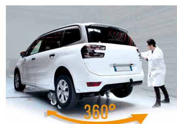
Ruota che permette di spostare il veicolo di 360°.