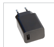
Caricabatterie 12 V