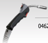
Push Pull fáklya (24 V)

046283 4 m 3 kg 220 A (20%) ⊕ 0,8 → 1,2 0,8 □ 1,2