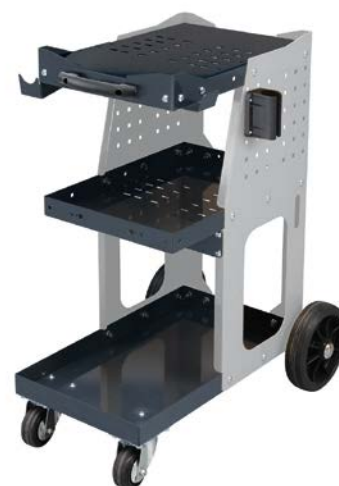
Chariot Trolley Spot 800 (en option) Réf: 051331