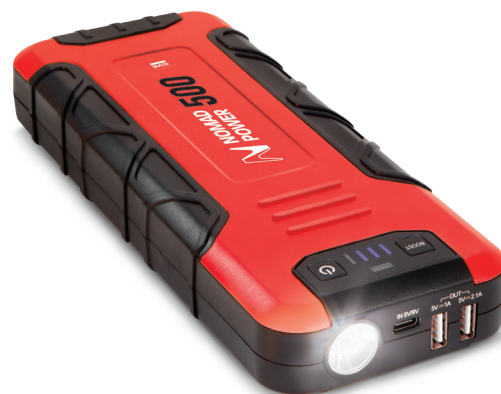
LED de chargement

Très léger ( 610 g ) et compact , il trouvera idéalement sa place dans la boîte à gants ou le vide poche du véhicule ainsi que dans un sac de voyage.