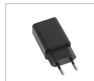
Chargeur 230 Vac / 5 Vdc