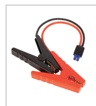
Câble de démarrage