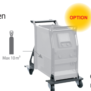
Chariot ref. 040960

À l'aide d'une option facile à poser, il peut se transformer en poste sur roues avec support bouteille 10m 3 .