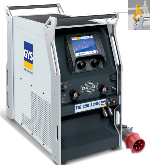
Livré sans accessoires