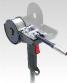
Torch Spool Gun

046283 4 m 3 kg 220 A (20%) ⚙️ 0,8 → 1,2