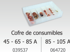
Cofre de consumibles 45 - 65 - 85 A 039537 85 - 105 A 064720