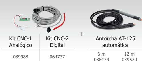
Kit CNC-1 Analógico 039988