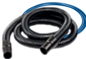
1 schlauch 3 m | Ø 29 mm