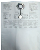
1 staubbeutel (Art.-Nr.: 058880 - 5 Taschen)