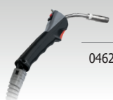
Push Pull Brenner (24 V)