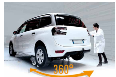
Räder zum einfachen Rangieren des Fahrzeuges (bis zu 360°)