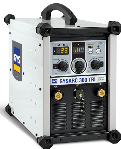
Leveres uden tilbehør