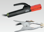
MMA-sæt 300 A - 4 m - 35 mm 2 038295