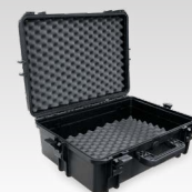
Pouzdro na stavbě IP67 060432