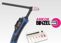
SR26DB - 4 m 038271