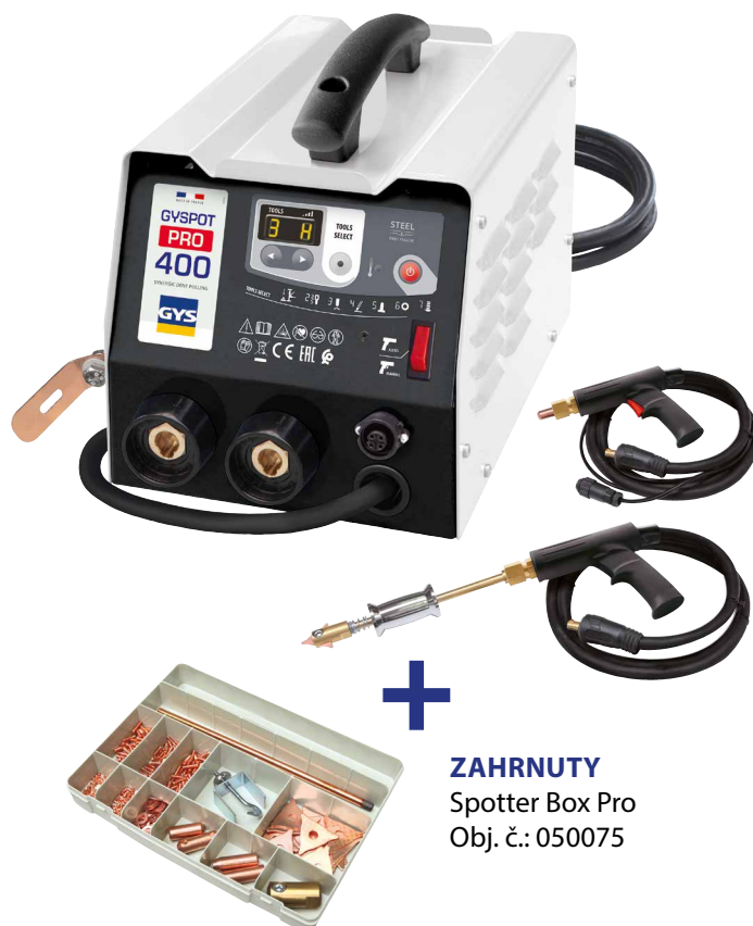
ZAHRNUTY Spotter Box Pro Obj. č.: 050075