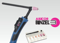
SR26DB - 8 m 038271