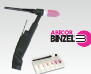
SR26L - 8 m 046184