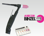
SR26L - 8 m 046184