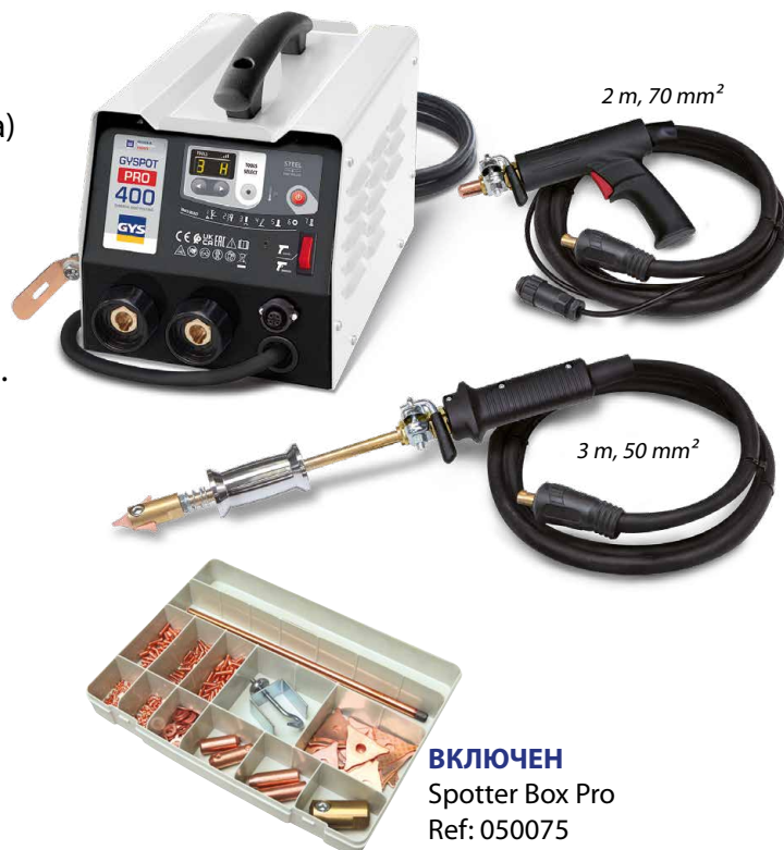
ВКЛЮЧЕН Spotter Box Pro Ref: 050075