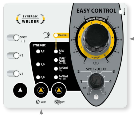
Режим синергії з прямим регулюванням параметрів зварювання