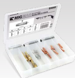
Набір пальників MB36 (350 A) 041417