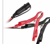
Затискачі (45 см)