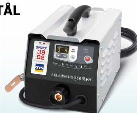
EASYLINER 39.02 - ref. 053618