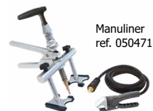
Manuliner ref. 050471