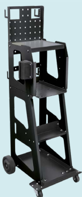
Spot 1000 vagn ref. 053540