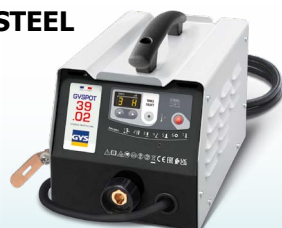
EASYLINER 39.02 - ref. 053618