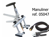
Manuliner ref. 050471