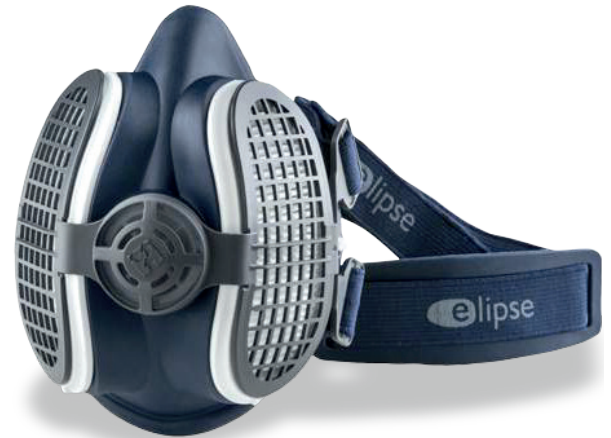
Фильтры поставляются в наборе

Для производства этой маски и фильтров использовались гипоаллергенные материалы без запаха, не содержащие латекса и силикона, уровня качества медицинских изделий.