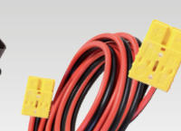
Андерсон/Андерсон 175 А 5 m - 16 mm 2 069107