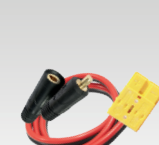
Андерсон<->Техас 0.2 m - 16 mm 2 055902 1 m - 16 mm 2 028791