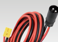
Андерсон/HATO 2.5 m - 16 mm 2 026810