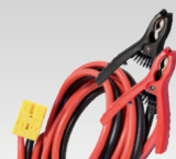
Андерсон/Зажимы 2.5 m - 16 mm 2 056503 5 m - 16 mm 2 054615 8 m - 16 mm 2 056572