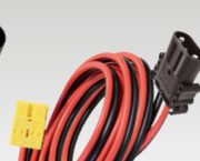
Андерсон/Рема 160 А 5 m - 16 mm 2 069091