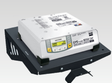
Полка с настенным креплением 055513