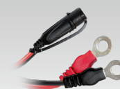
Коннектор для наконечника 45 см - M6 029194