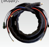
5 m 70 мм² 047617 10 m 70 мм² 047624 10 m 95 мм² 047631