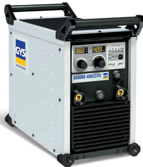
Поставляется без аксессуаров