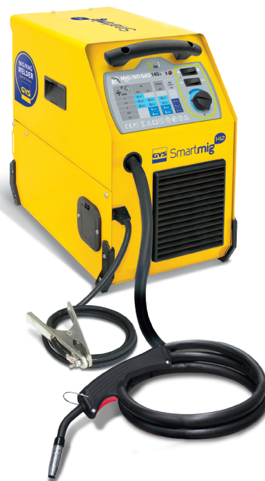
Livrat cu cablu de masă și un pistol fix de 2 m.

Ventilatorul său cu debit constant îl protejează de supraîncălzire