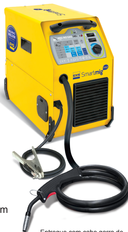
Entregue com cabo garra de massa e toche fixa 2m.

Seu ventilador a débito constante a protege de sobreaquecimentos.