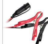
Alicates (45 cm)