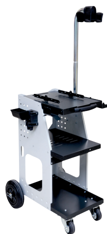
ref. 051331 + 052284 UNIVERSAL 800 + Arm med overheng