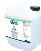
ref. 062511 kjølevæske spesialisveising - 5 l