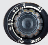
Tint 5&gt;13 en slijp-stand