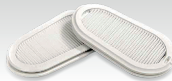
2 extra FFP3 filters 037038