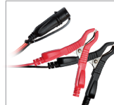
Klemmen (45 cm)