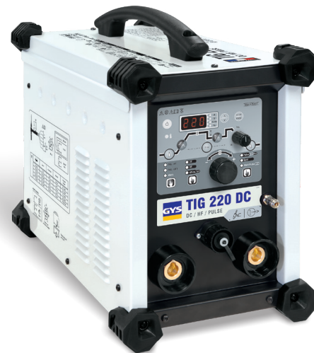
Geleverd zonder accessoires