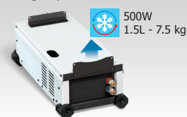
WCU 0.5kW A 039490