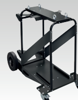
Trolley 10m 3 039711