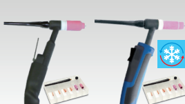
SR26 L 046184