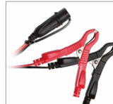
Spaustuvai (45 cm)