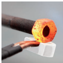
Sbloccaggio dei bulloni