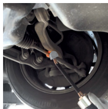
Sbloccaggio dei tiranti