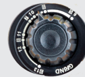
Tinta 5 > 13 e modalità di rettifica