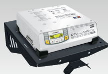
Supporto a muro 055513