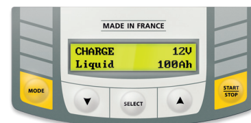
Interfaccia intuitivo disponibile in 22 lingue