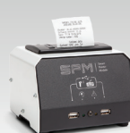
SPM : Modulo stampante 026919