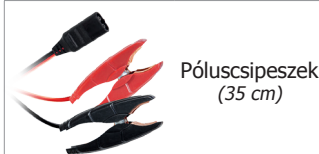
Póluscsipeszek (35 cm)