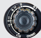
Teinte 5>13 et mode meulage