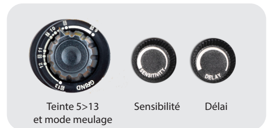
Teinte 5>13 et mode meulage