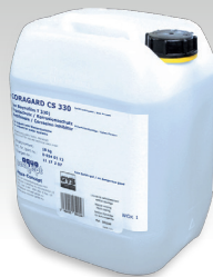
Liquide de refroidissement CORAGARD CS 330 - 10 L ref. 052246