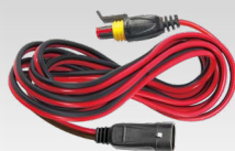
Jatkokaapeli 2,5 m - 029057