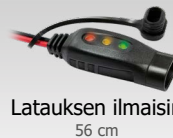
Latauksen ilmainen 56 cm