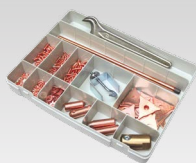
Spotter Box Pro 050075